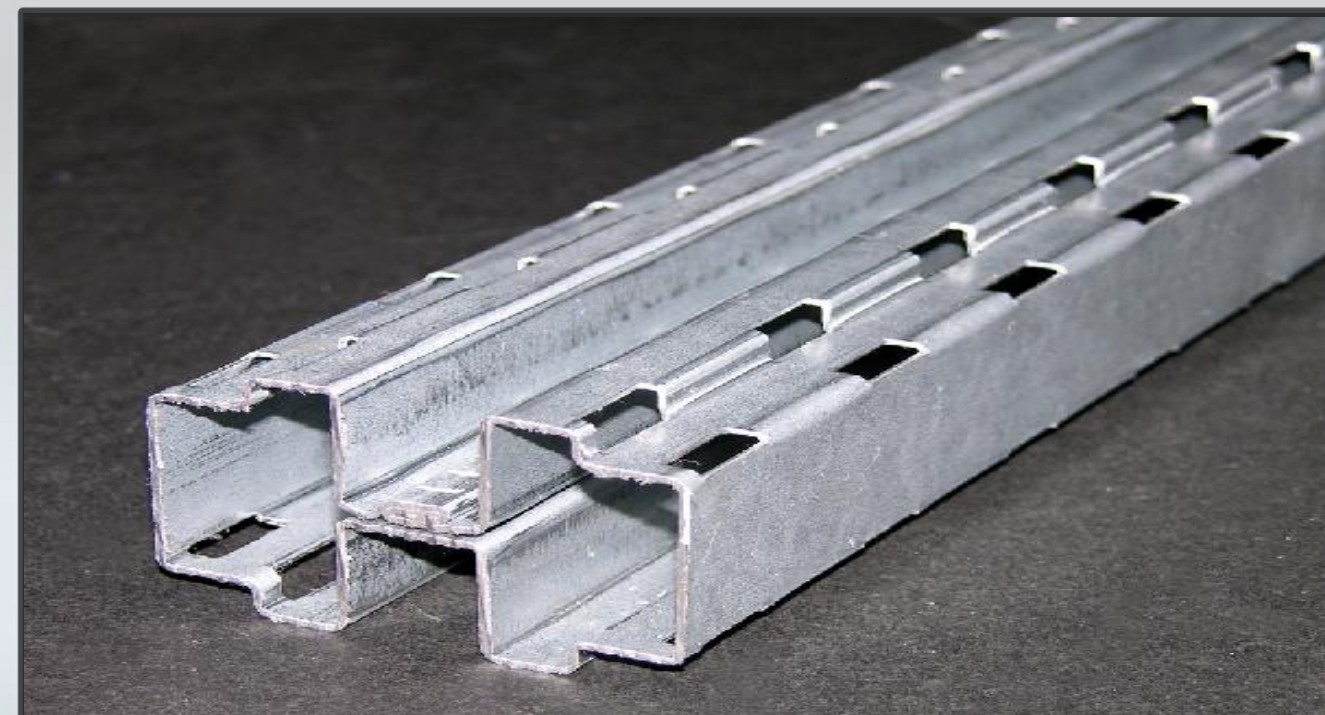
Esempio di prodotto finito