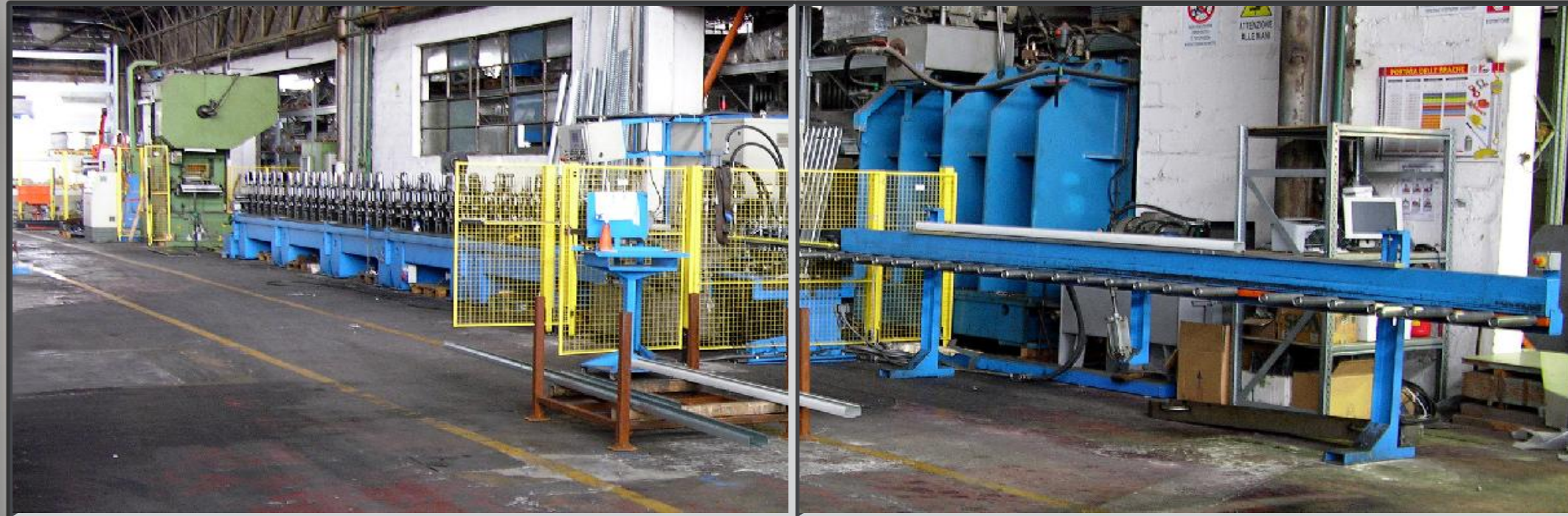
Vista di assieme linea

La linea per produzione montanti per pareti mobili tipo L è una linea in grado di realizzare i prodotti citati di varia forma e di spessore da 0.8 a 1 mm. La linea prevede un aspo da 5 t e una raddrizzatrice posti subito prima della pressa nella quale sono alloggiati degli stampi di pretranciatura che realizzano tutte le lavorazioni necessarie prima di procedere alla profilatura del profilo. Nella successiva trancia volante vengono ultimate le lavorazioni sul profilo e viene fatto lo stacco dello stesso, il successivo banco di scarico provvede a portare fuori linea il prodotto finito.