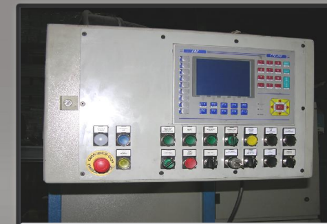
Pannello di controllo