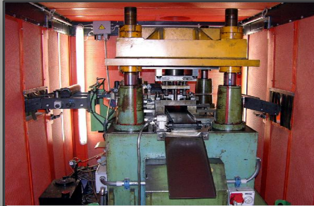
Pressa completa dello stampo

Linea di produzione profili paraspigoli per pavimenti o di contorno in genere. Materiale acciaio inox, alluminio, ottone, ecc.... Possibilità di mettere attrezzature (serie di rulli) appaiate sulla profilatrice. Cambio rapido profilatrice a cassette. Taglio fisso. In opzione taglio volante. Possibilità di inserimento automatico etichette con codice a barre.