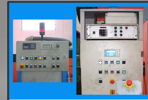
Pannelli di controllo