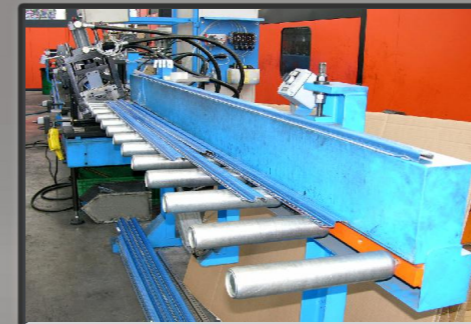
Banco di scarico