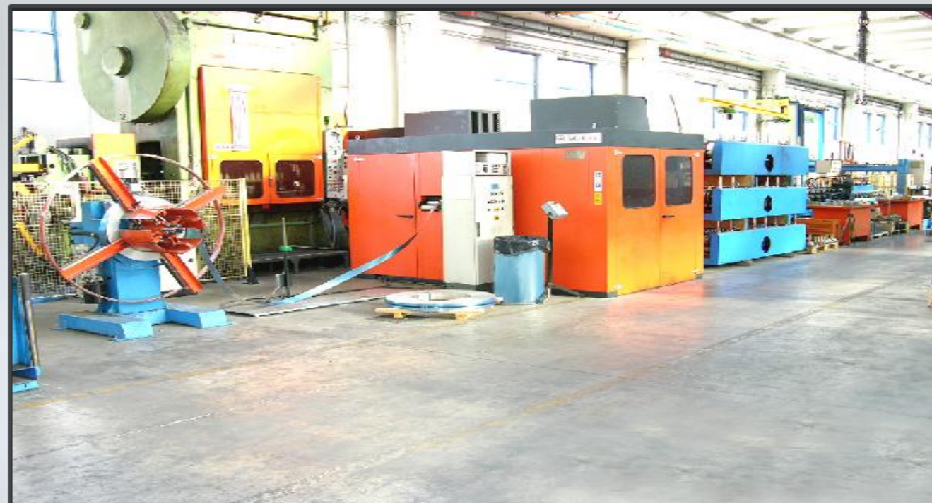
Vista di assieme macchina