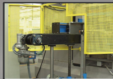
Banco di scarico e impilaggio