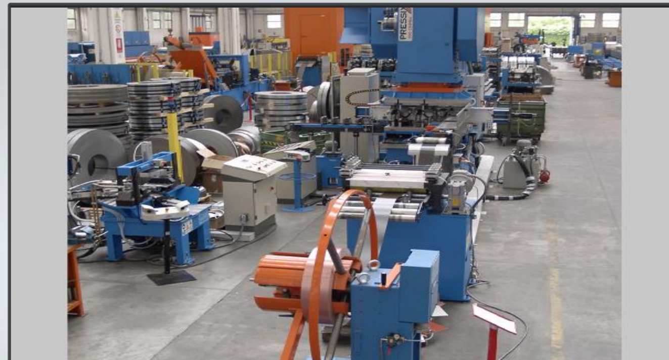
Vista di assieme linea