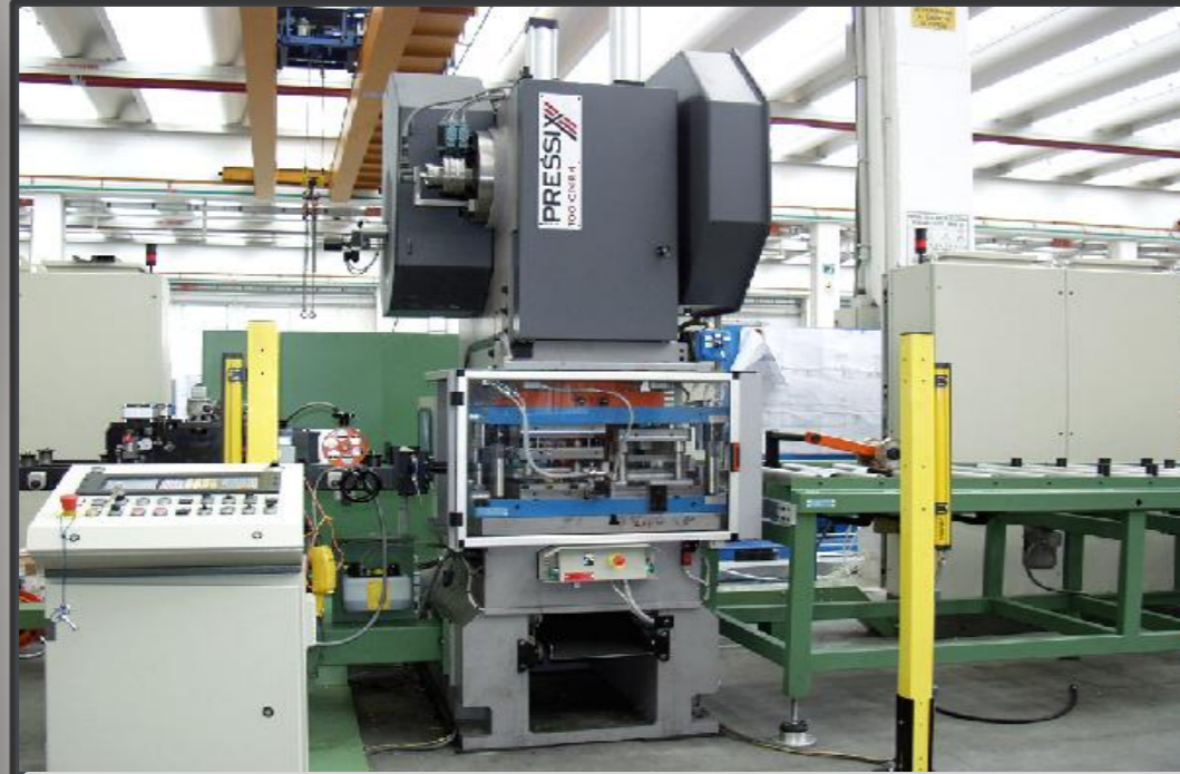
Pressa completa dello stampo

Linea per produzione grigliati da nastro per canalette scarico acqua a forma di "C" semplice e a forma di "T". N°2 attrezzature (serie di rulli) diverse montate appaiate sulla profilatrice. Il taglio e la punzonatura vengono eseguiti prima della profilatura in modo da non cambiare stampi di taglio. Il cambio di larghezza sulla profilatrice avviene con distanziali. Tra la pressa di punzonatura e il taglio e la profilatrice (piegatura) abbiamo una rulliera motorizzata di trasporto con un sistema di centraggio da un profilo a un altro. Scaricatore - impilatore in opzione.