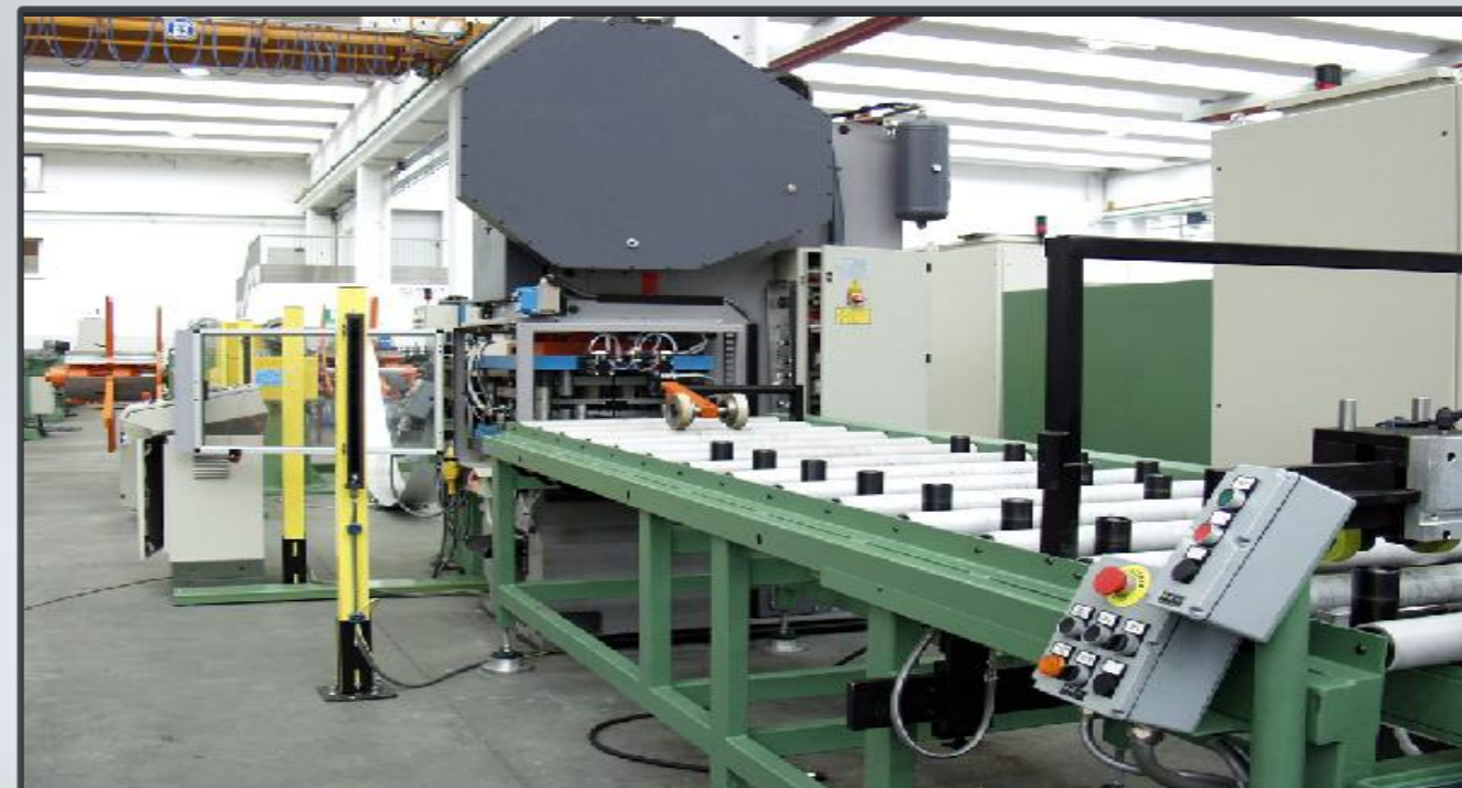
Vista pressa e rulliera motorizzata