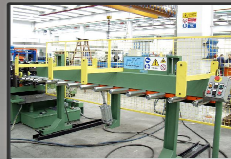
Banco di scarico