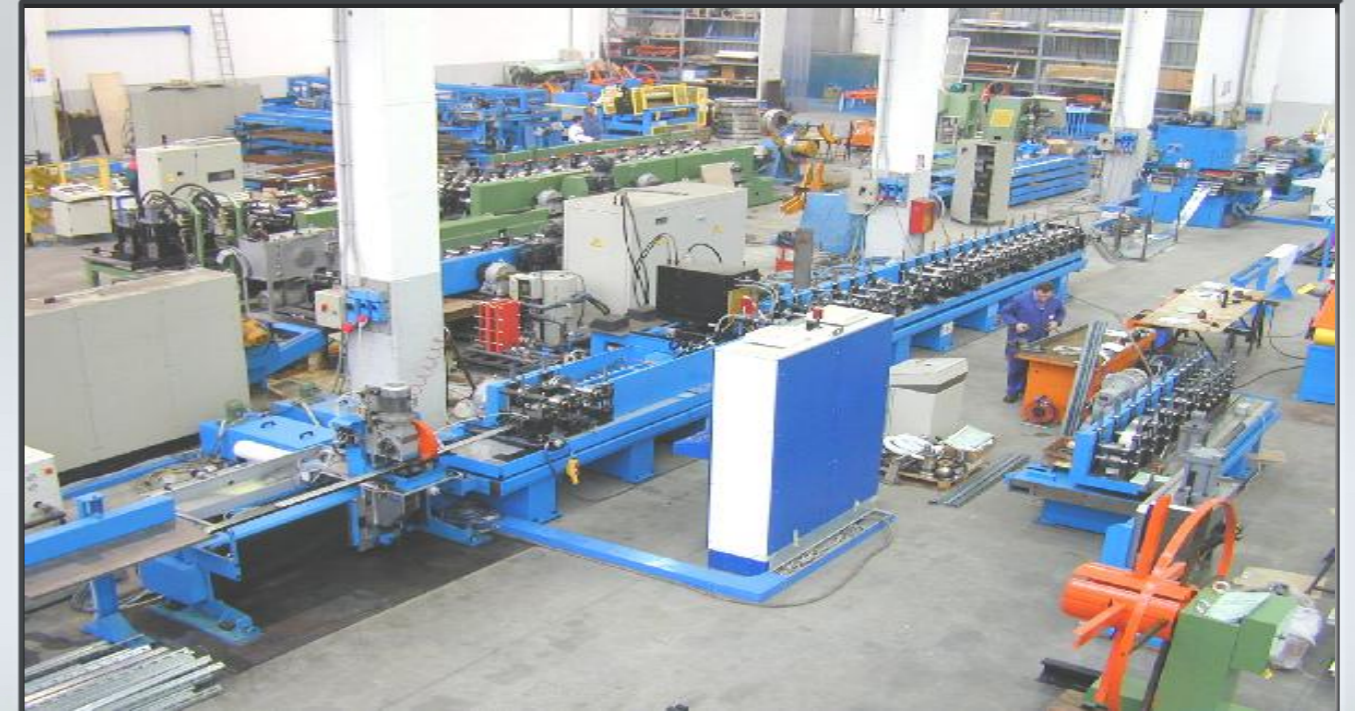
Vista di assieme macchina