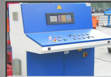
Pannello di controllo