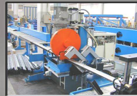
Sega di taglio volante e banco di scarico