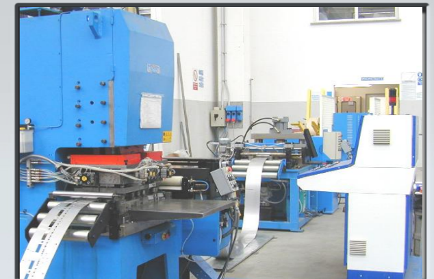
Aspo, banco di intestatura e saldatura, pressa